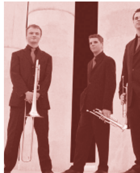
Erfolgreiches Ensemble: Or Notes Brass.

be FN W Ly da 12 1. tu: der jen er- für ale